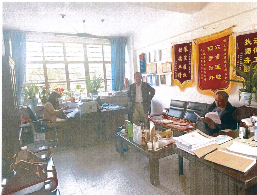
2022 年 6 月 17 日上午到楚雄市永安法律服务所进行“双随机”检查